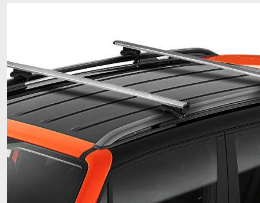
Barra transversal de techo par