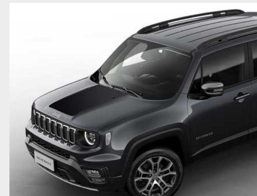
Adhesivo antirreflejo Longitude