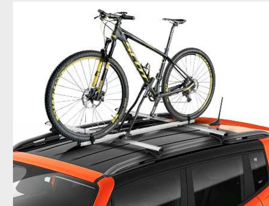
Soporte de bicicleta para techo