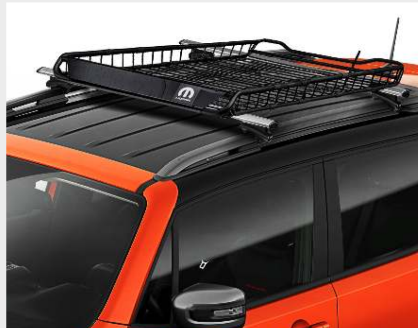
Parrilla portaequipaje MOPAR