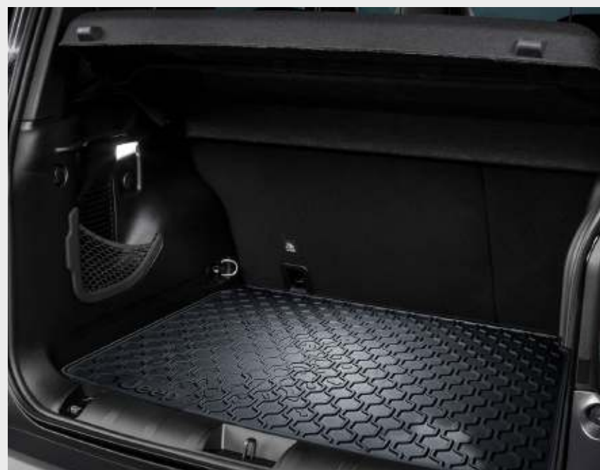
Alfombra baúl Longitude